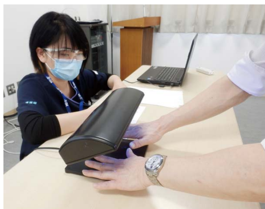
手洗い後の洗い残しをチェック

※200床未満の医療機関に認定看護師の配置を促進する目的の基金。30都道府県58医療機関1介護施設に助成がありました。