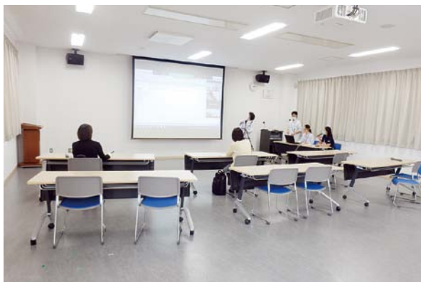
密を避けて開催しました

コロナ禍であっても本人や家族の気持ちを最大限尊重し、地域の皆さんと協力し一緒に支え合っていく環境を整えていきたいと思ひます。