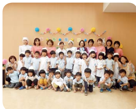
昨年のプチナース看護体験の様子