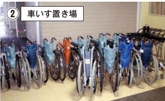
車いすやベビーカーは風除室にあります