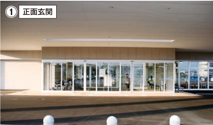
屋根を広くして、雨に濡れずに車から乗り降りできるようになりました