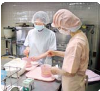
病棟看護師→栄養科