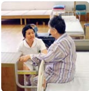
病棟看護師→リハビリテーション科

地域に必要な安全で良質な医療を提供できるよう、病院にはいろいろな専門職がチーム医療に取り組んでいます。患者様・ご家族を中心に各専門職が専門性を活かして医療を提供させていただきます。チーム医療を円滑に運用するには各職場の相互理解が必要です。