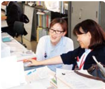
臨床検査技師→栄養科