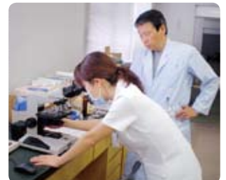
外来看護師→臨床検査科