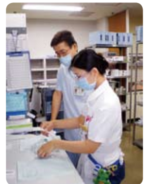
病棟看護師→薬剤科

そこで、当院では、平成17年より入職後2年目の5月に「院内他部署研修」を行っています。好きな部署での1日研修を2日間、その職種のユニホームを着ての体験をしています。今年度は23年度入職した9人が他部署を体験しました。体験を行った職員はそれぞれ有意義な経験ができたようです。