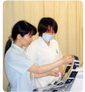
手術室看護師→臨床検査科