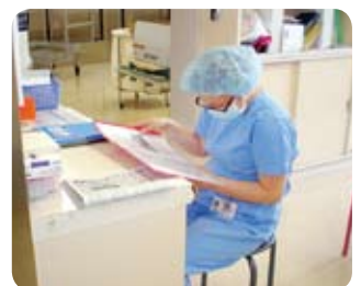
血液浄化センター看護師→手術室