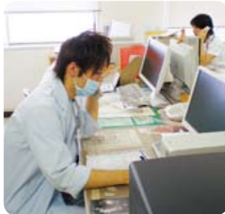
理学療法士→医療サービス推進室