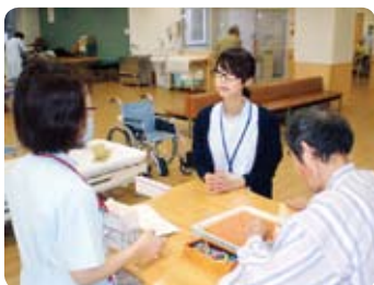
事務職→リハビリテーション科