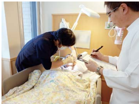
歯科医師訪問検診の様子